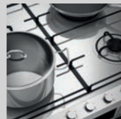
Hob Piano cottura